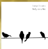
「Birds on a wire」